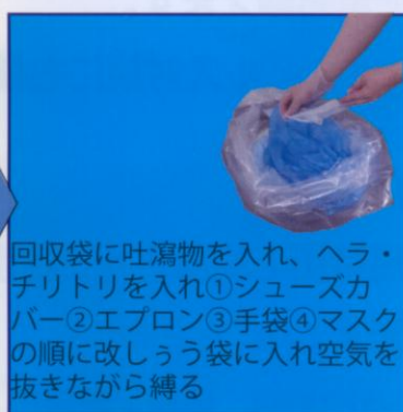
回収袋に吐瀉物を入れ、ヘラ・チリトリを入れ①シューズカバー②エプロン③手袋④マスクの順に改しゅう袋に入れ空気を抜きながら縛る