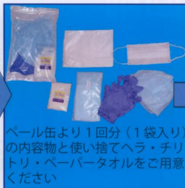
ペール缶より1回分(1袋入り)の内容物と使い捨てヘラ・チリトリ・ペーパータオルをご用意ください