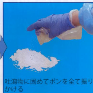
吐瀉物に固めてポンを全て振りかける