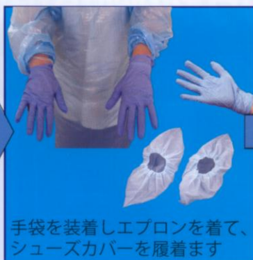
手袋を装着しエプロンを着て、シューズカバーを履きます