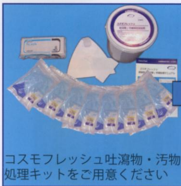
コスモフレッシュ吐瀉物・汚物処理キットをご用意ください